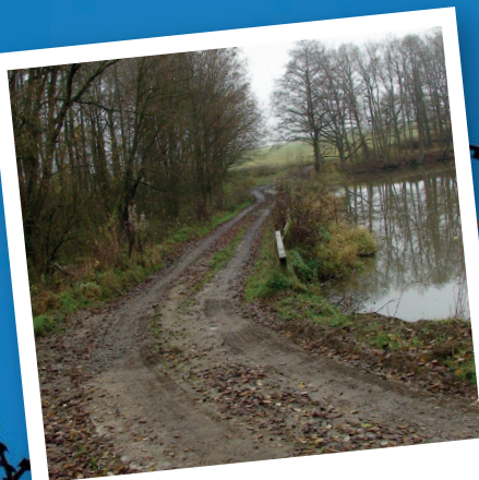
Falešná hranice na hrázi Myslivského rybníka

Výstava v malém sále potrvá až do 2. února 2025 a je volně přístupná v provozní době a na požádání.